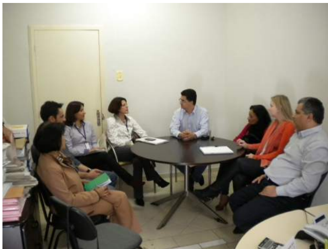
Reunião na Prefeitura Municipal de Campo Mourão com representantes da SEJU, Prefeitura Municipal, UNIOESTE e do extinto pró-egresso