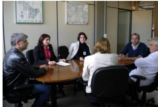
Reunião na UNIOESTE com o Pró-Reitor e assessores