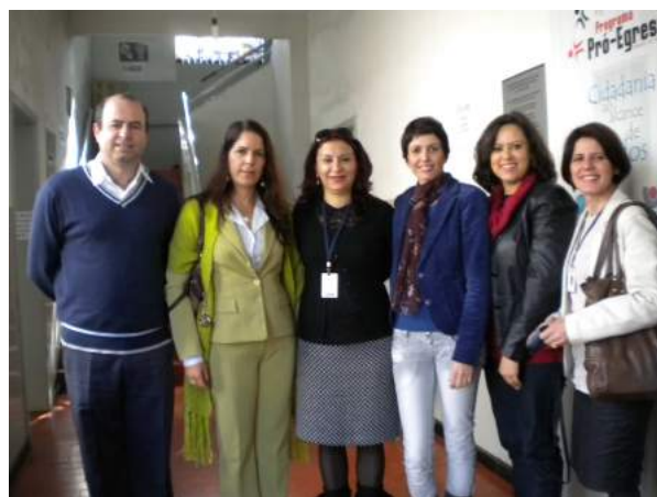
Visita às instalações do antigo Pró-Egresso, onde deverá funcionar o Programa Patronato