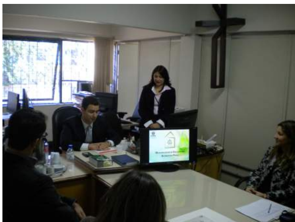
Reunião na VEP – Francisco Beltrão