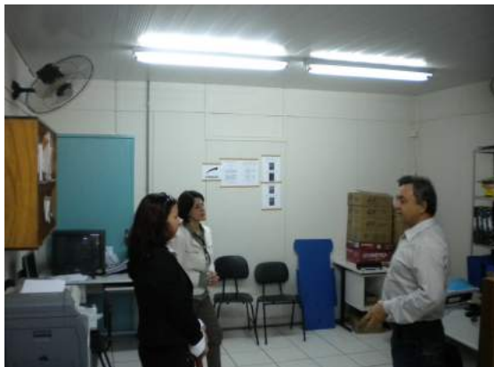
Visita à sala do extinto Programa Pró-Egresso no campus da UEM