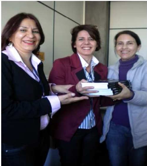
Visita a Edunioeste – Editora da UNIOESTE