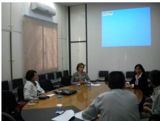
Reunião na Prefeitura de Maringá