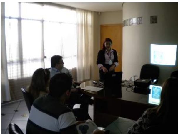
Reunião Gabinete do Prefeito de Francisco Beltrão