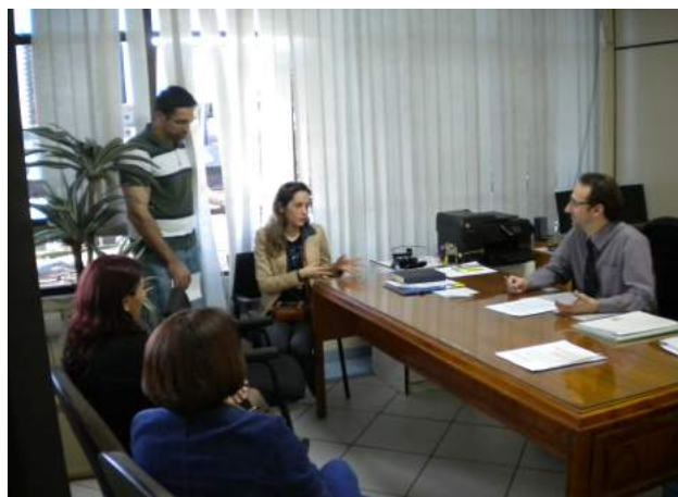
Reunião Gabinete da Assessoria Jurídica