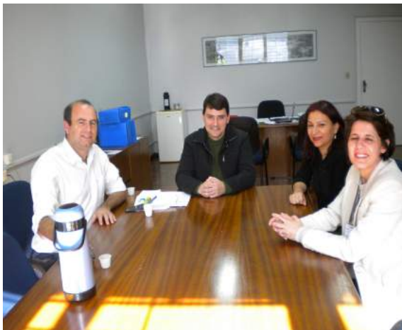
Reunião com Diretor Geral da UNIOESTE com vistas à apresentação de Projeto junto à SETI para inclusão de Cascavel no Programa Patronato