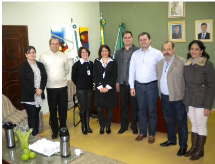
Reunião na Prefeitura Municipal de Assis Chateaubriand com representantes da SEJU, Prefeitura Municipal, Conselho da Comunidade e do extinto Pró-Egresso.