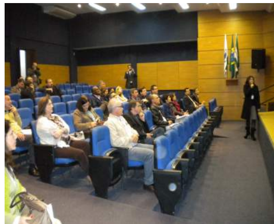
Apresentação do Programa Patronato