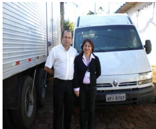
Visita ao Pátio da Delegacia de Toledo – Veículo Van – doado para Programa Patronato