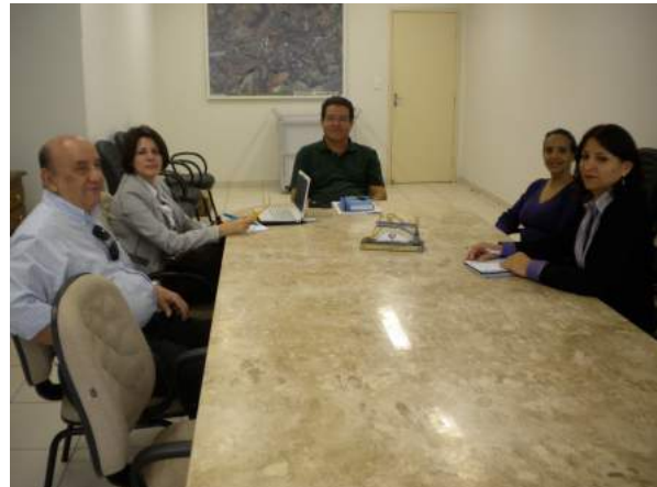
Reunião na Prefeitura com o Chefe da Divisão de Assuntos Comunitários da Secretaria do Bem Estar Social