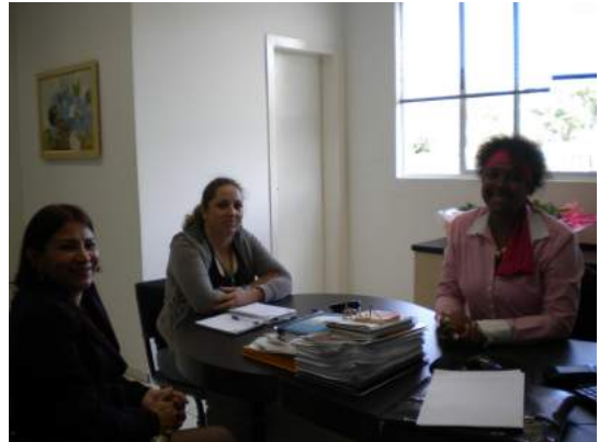
Reunião Prefeitura de Pato Branco