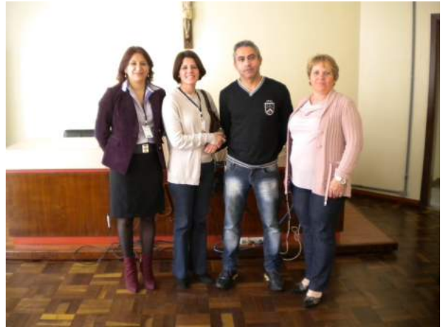
Visita ao Fórum de Pitanga