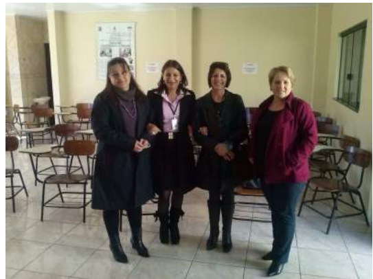
Sede do Conselho da Comunidade - Irati