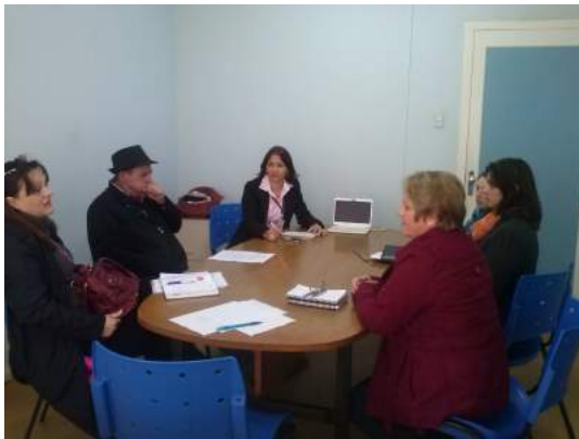
Reunião no Gabinete da Prefeitura de Irati