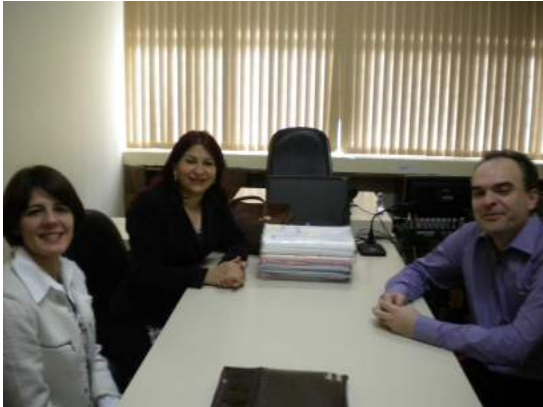
Reunião Fórum de Pato Branco