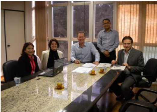
Reunião com o Prefeito Moacir Froehlich e assessores