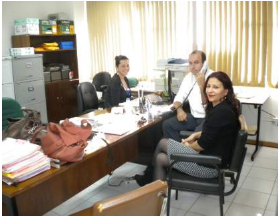
Visita às instalações do Pró-Egresso e do Programa "Aberto-Provisório" localizado no Fórum de Cascavel.