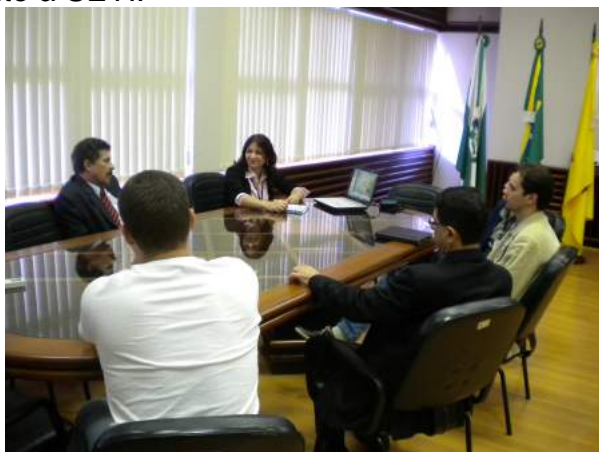
Reunião na Prefeitura Municipal de Paranavaí.