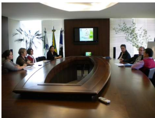
Reunião Gabinete do Prefeito de Guarapuava