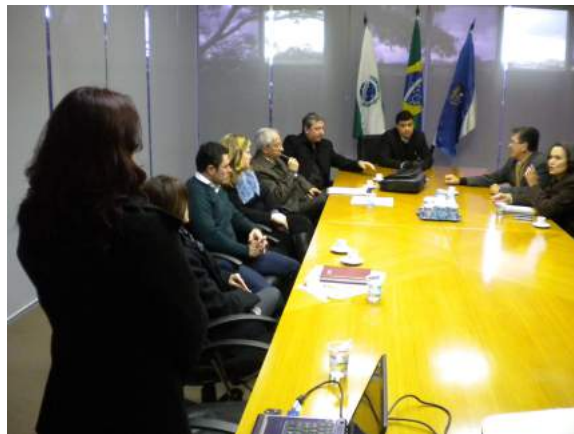
Reunião Gabinete do Prefeito de Guarapuava