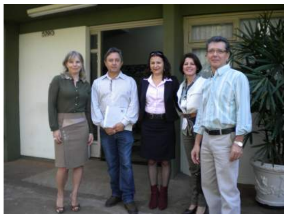
Universidade Estadual de Maringá