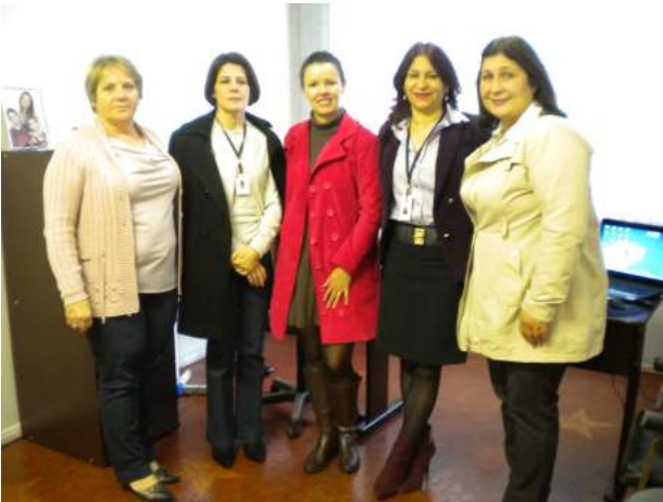
Reunião na Prefeitura de Pitanga