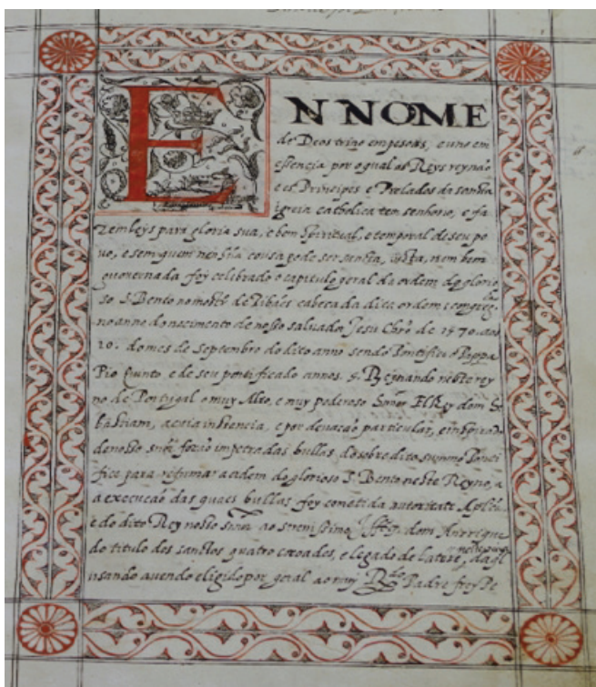
Fonte: Página inicial do Bezerro I (1570-1611).